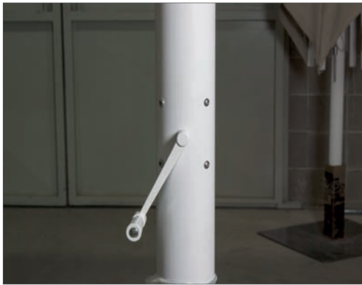
Sistema de apertura con manivela