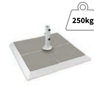
Base Superficie con Baldosas