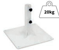
Base Fijación al Suelo