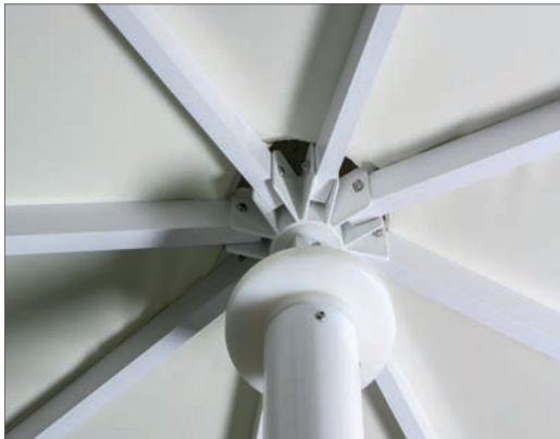
Fijación individual de las varillas