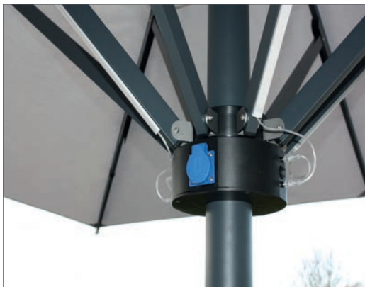
Kit de conexión + Iluminación LED integrado