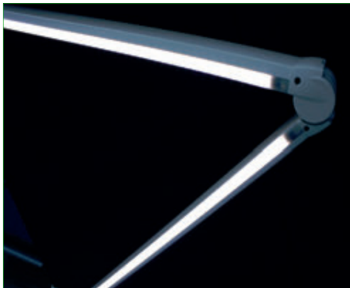
Différents types de base