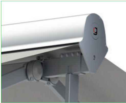
Estructura en aluminio