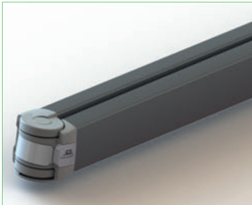
Instalación de cofres 5036