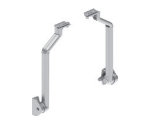
Bras en aluminium avec tension