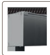
PLAFOND (Fixation Coffre)