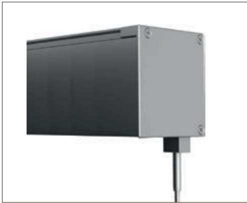
Système de guidage par Câble de 4mm