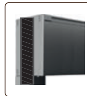
ENTRE MURS (Fixation Guides)