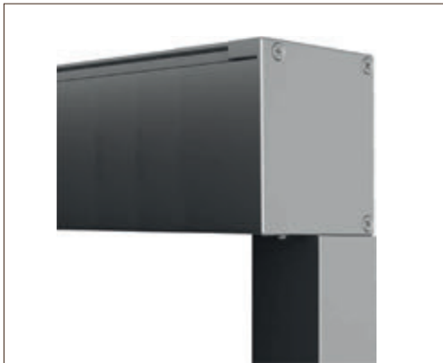
Système de guidage par Guide