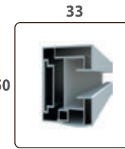
GUIDE LATERAL ZIP