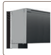
FACE (Fixation Coffre)