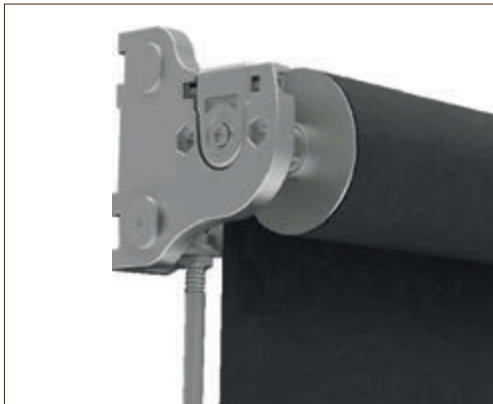
Guidage par tiges de 10mm