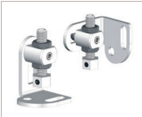
Support fixation mur/sol