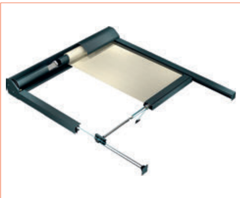
Système de tension par ressorts