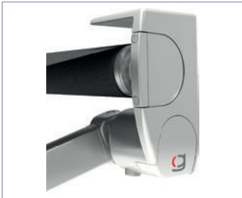
Supports en aluminium