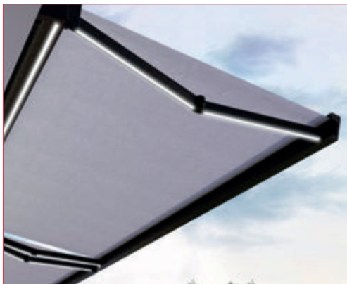
Éclairage LED intégré (en option)