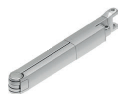
Brazos Arko con cinta Téxtil