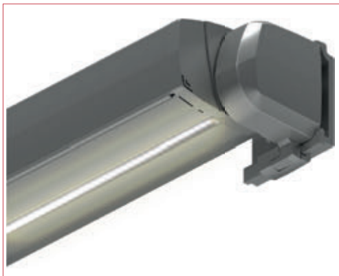
Iluminación LED integrada en el perfil cofre (opcional)