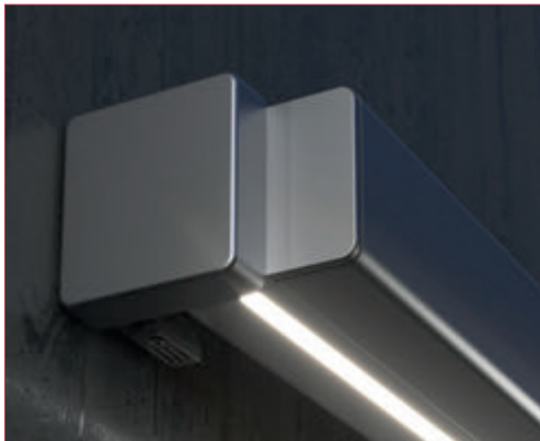
Diseño cuadrado del perfil frontal y las tapas