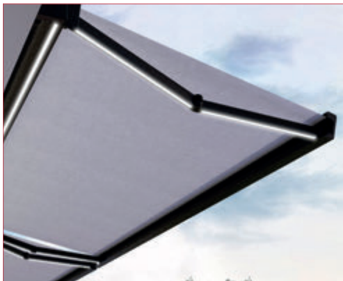
Iluminación LED integrada (opcional)