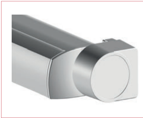
Perfiles y tapas laterales en aluminio