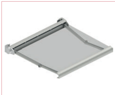
Toldo cofre de dimensiones reducidas