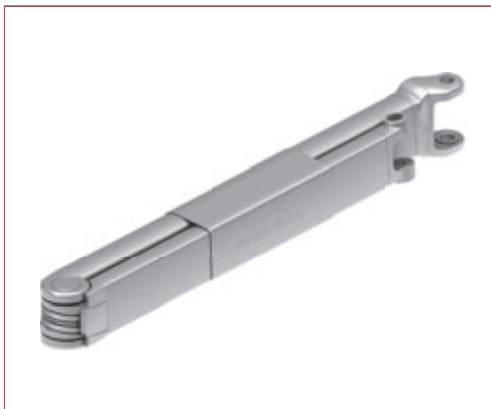
Brazos Smart con tensión interna