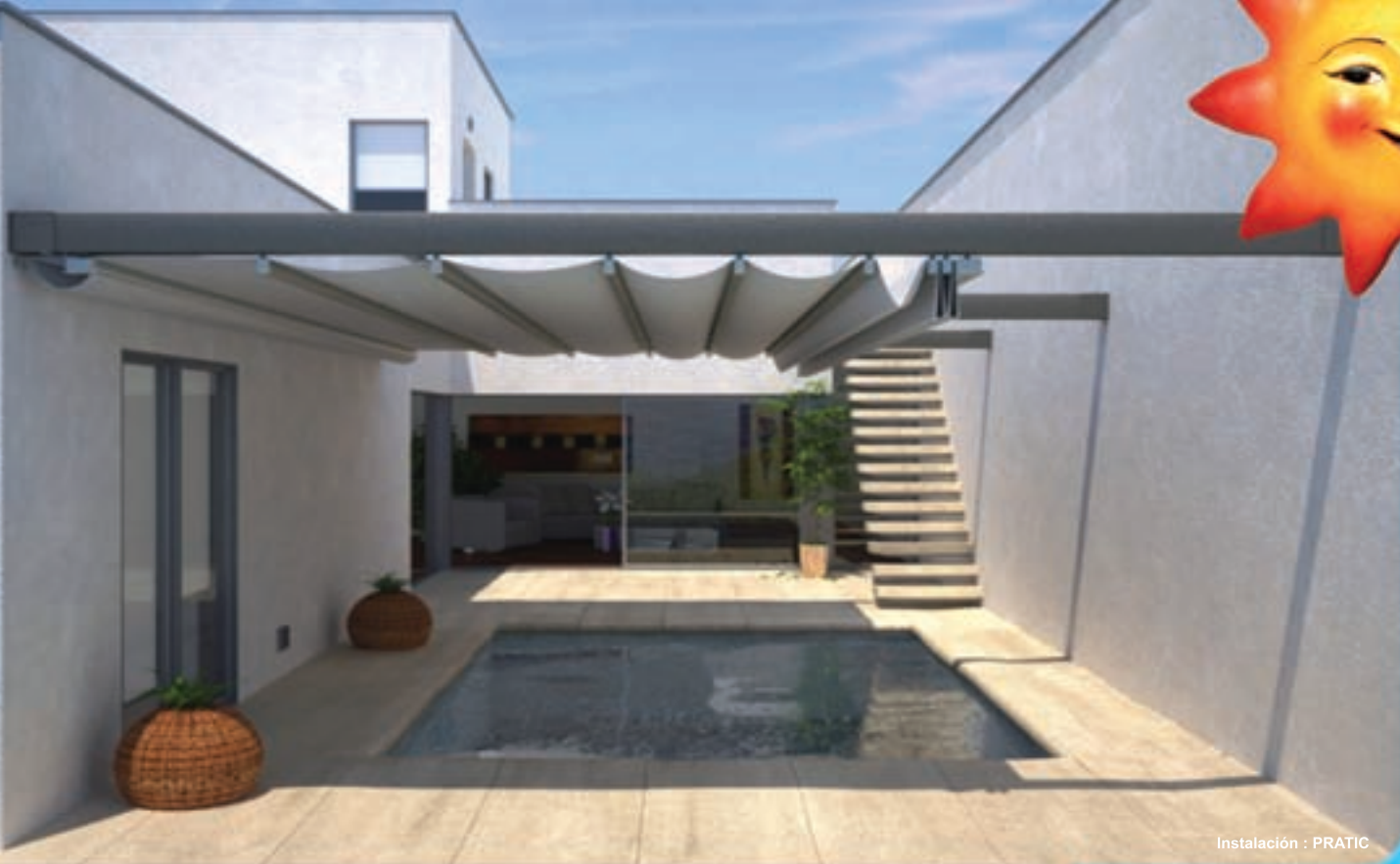
Instalación : PRATIC