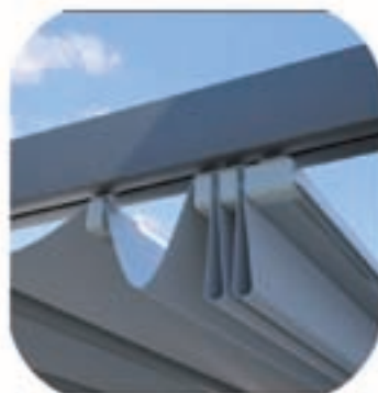
Pendiente mínima para el desagüe